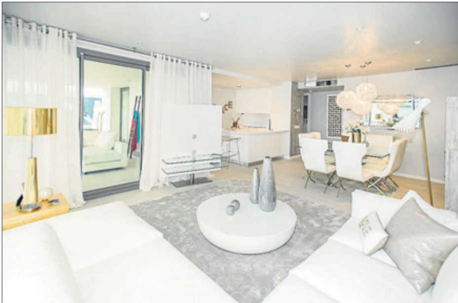
Salón del piso piloto que ya puede visitarse en The White Angel.