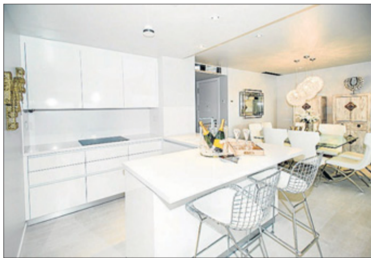
La cocina, con diseño minimalista y las mejores marcas.

Líneas puras, acabados perfectos, diseño minimalista y esencia mediterránea son los secretos de esta promoción que estará finalizada antes del verano de 2014. The White Angel debe su nombre al color de la isla blanca (White), y al confort, el diseño y la búsqueda