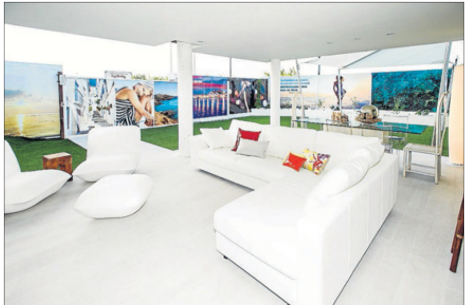
Una magnífica terraza en la planta baja de tres habitaciones.