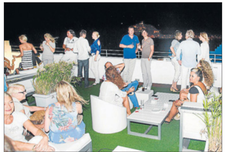
Imagen del cóctel que se ofreció en el Sky Bar de Ocean Drive.

lo tiene en cuenta The White Angel: «Queremos que cuando la persona esté en su vivienda perciba el lujo, que se encuentre como si estuviera en un hotel». Por ello, al